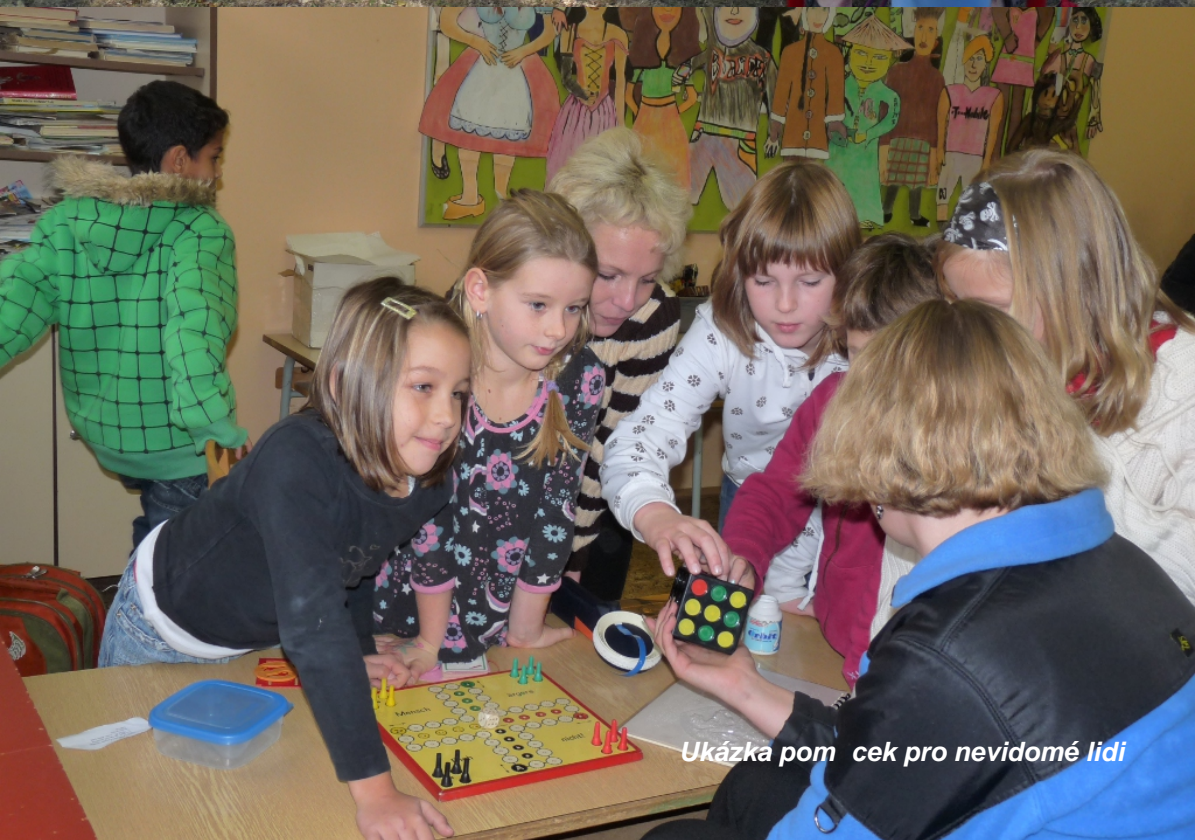
Ukázka pomůcek pro nevidomé lidi