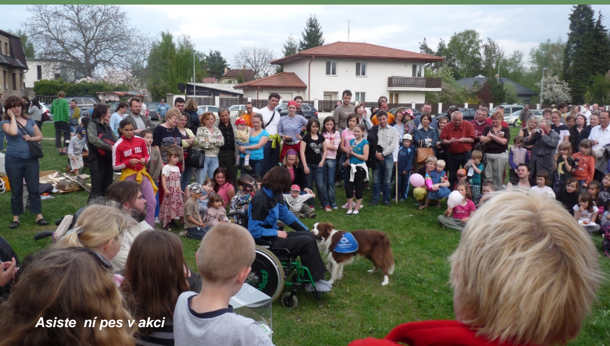
Asiste ní pes v akci

Nejvyšším orgánem je Správní rada, která se schází 2x ročně. Volí dozorčí radu a jmenuje výkonného editela společnosti.