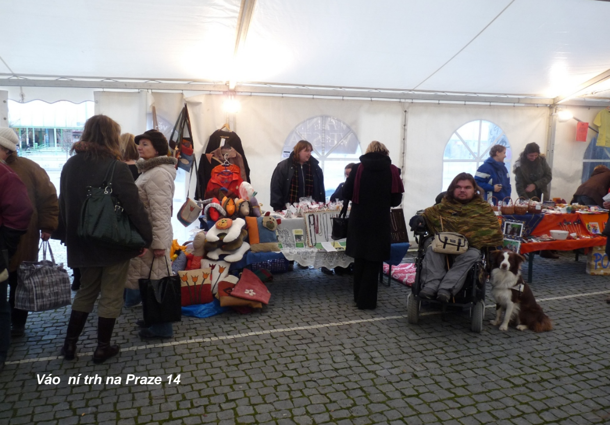
Váo ní trh na Praze 14