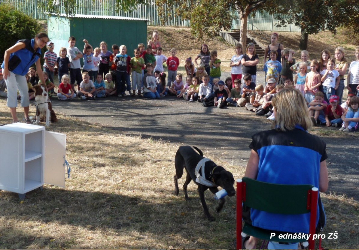
P ednášky pro ZŠ