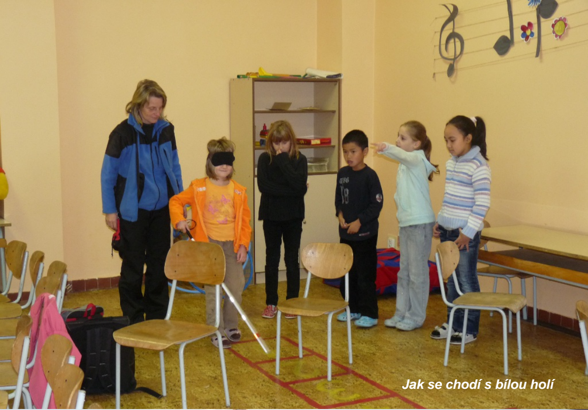
Jak se chodí s bílou holí