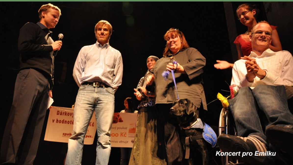
Koncert pro Emilku