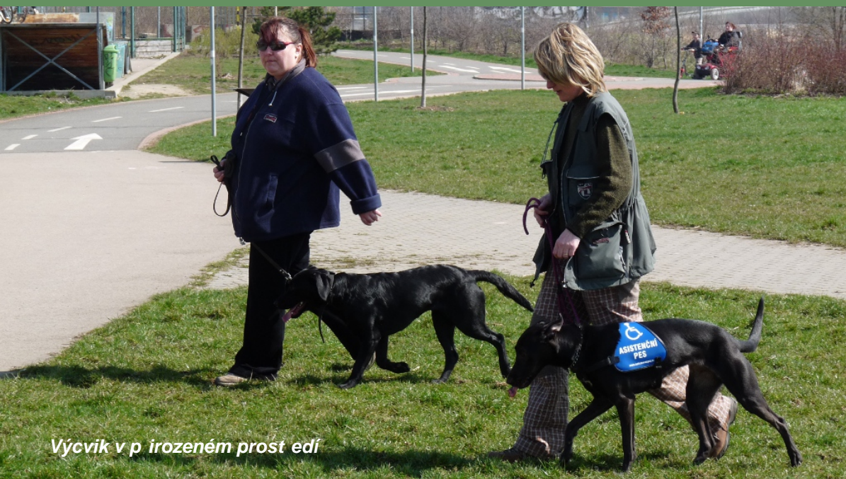
Výcvik v p irozeném prostředí

1. Kvalitní výcvik a předání asistenčních psů pro osoby se zdravotním postižením Kvalitní a pe livá práce našeho týmu je založena na individuálním p ístupu k lov ku, na základ Etického kodexu a Metodiky práce. Principy práce s lidmi vycházejí z jejich individuálních pot eb. Zárukou profesionality je vysoká míra sebereflexe, kdy jednotliví cvitelé si svou práci navzájem konzultují. Rovn ž využíváme kontroly a konzultací s dalšími osobami, které mají blízko k profesionální kynologii. S našimi klienty spolupracujeme již od výb ru vhodného plemene až po kvalitní, plnohodnotné a bezproblémové soužití lov ka s jeho psem. Zabýváme se také ochranou práv našich klient a prosazujeme jednotné postavení všech asistenčních psů na stejnou úroveň .