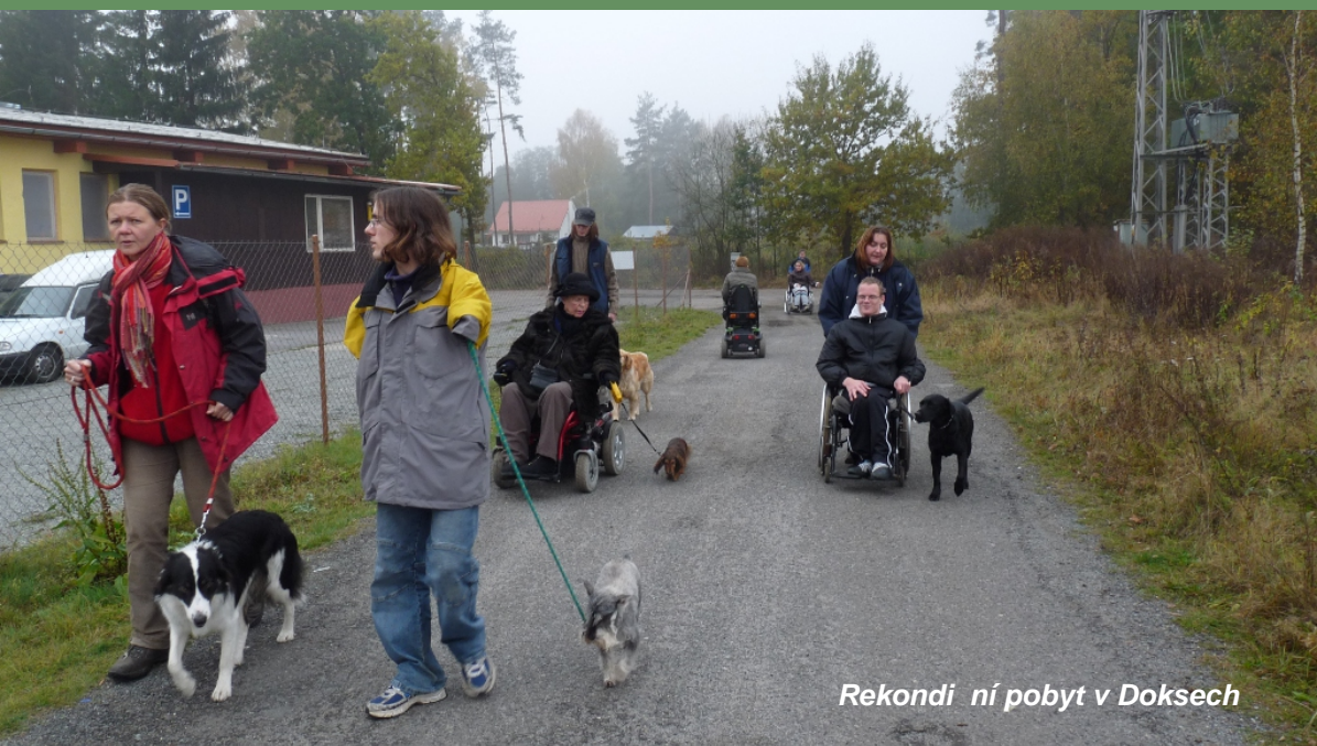
Rekondiční pobyt v Doksech

Naše obec prospěšná společnost vznikla začátkem roku 2009 z iniciativy několika lidí se společným zájmem o kynologii a práci v sociální oblasti. Tito lidé se rozhodli spojit svůj zájem a koníček ve svou profesi. Někteří z nově vznikajícího týmu se již kynologii profesionálně věnovali několik let. Další přinesli praktické poznatky a zkušenosti z práce v sociální oblasti. Byl tak položen dobrý základ pro naši novou organizaci pracující na profesionální bázi. Již před samotným vznikem organizace se naše snaha setkala s pozitivní odezvou a hlásili se zájemci o naše služby. Rodící se tým vzal založení organizace jako velkou výzvu a mnozí z nich si ihned začali doplňovat kvalifikaci, aby byli opravdovým přínosem a mohli poskytovat kvalitní služby pro společnost.