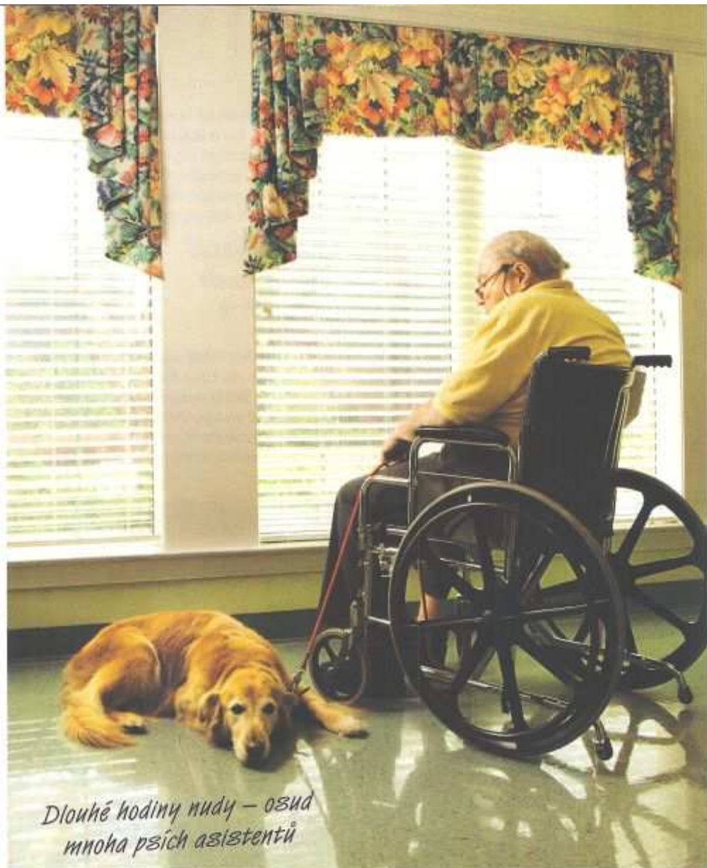
Dlouhé hodiny nudy – osud mnoha psích asistentů

Problémy potvrzují i odborníci, kteří cvičí asistenční psy. Oba břehy, jak pozici výcvikářky, tak pozici