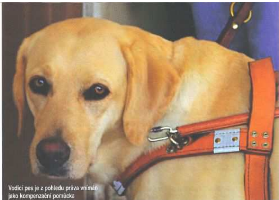
Vodící pes je z pohledu práva vnímán jako kompenzační pomůcka

Jak již bylo řečeno, centra pro výcvik asistenčních psů mají jen omezené kompetence. Přesto dělají, co je v jejich silách. A tak jsou se svými klienty v kontaktu. „To je samozřejmě. Přece nemůžeme mít psa nějakou dobu, a to ne zrovna v psím životě krátkou, pak ho „někam“ dát, a už o něm nic