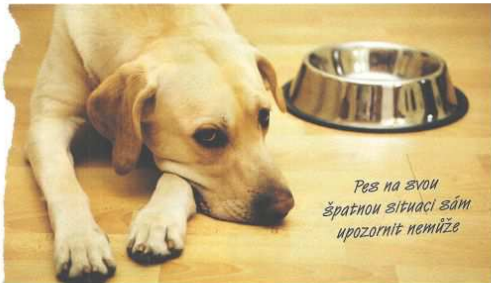
Pes na svou špatnou situaci sám upozornit nemůže

Text: Michala Jendruchová